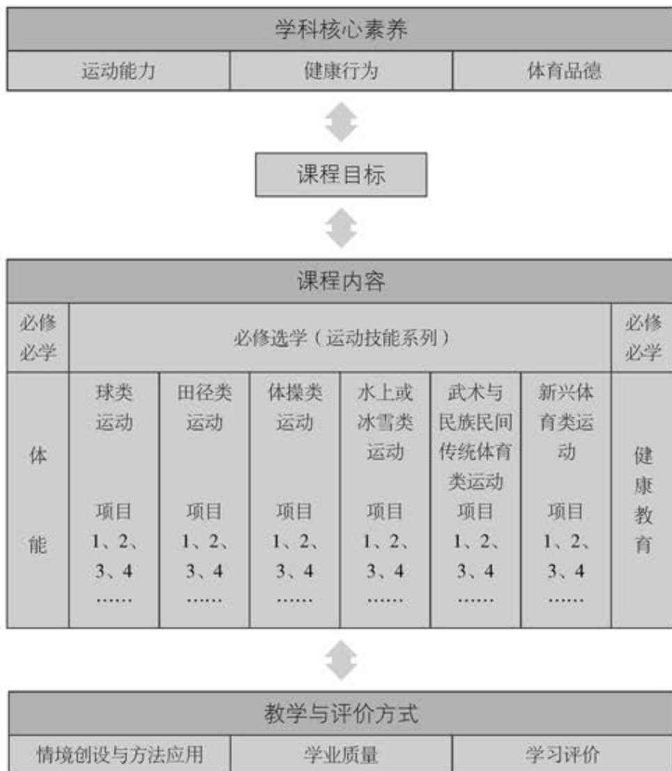
图1 普通高中体育与健康课程结构

及个性发展的需要，课程内容包括球类运动、田径类运动、体操类运动、水上或冰雪类运动、武术与民族民间传统体育类运动和新兴体育类运动6个运动技能系列。每个运动技能系列由若干运动项目组成，如足球、跳远、健身健美操、蛙泳、防身术、花样跳绳等，每个运动项目由包含相对完整内容的10个模块组成，以便学生对所选模块进行较为系统的学练。体能和健康教育包括内容要求、教学提示；运动技能系列中每个模块包括内容要求、教学提示和学业要求。